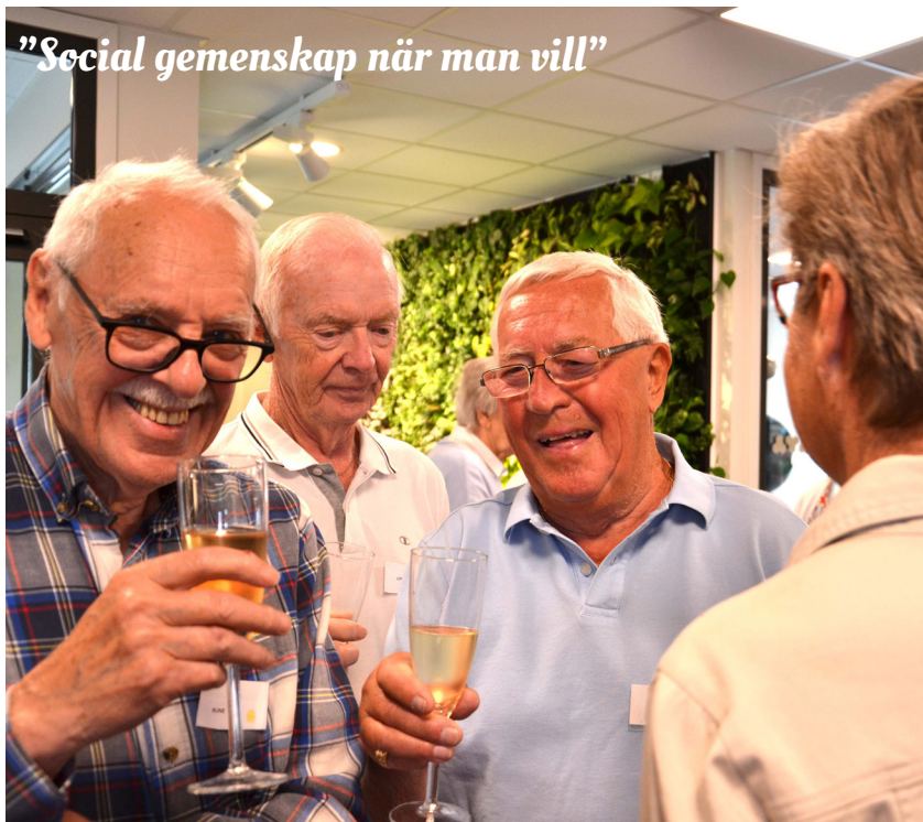
"Social gemenskap när man vill"