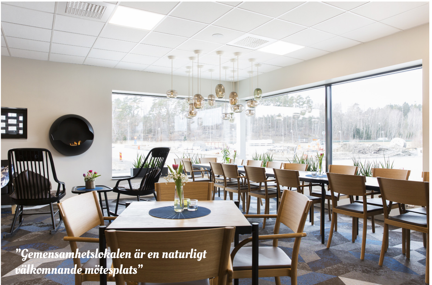
"Gemensamhetslokalen är en naturligt välkomnande mötesplats"