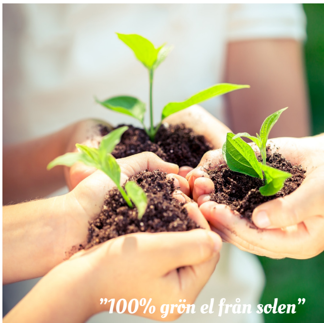
"100% grön el från solen"